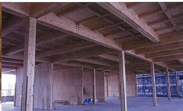
中断面集成材と住宅用梁受金物による6mグリッド2階床組+高倍率耐力壁

流通材とプレカット加工により、経済的な木造建築を実現可能 トラス屋根、高倍率耐力壁、高倍率水平構面などによる大空間 接合部詳細など標準図による設計手間の大幅削減 標準的な軸組工法を活用して、さまざまな中大規模木造建築が可能です