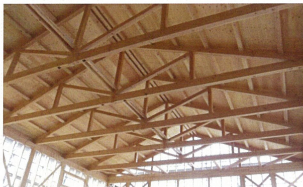
流通製材と住宅用プレカットによる12mスパン山形トラス

流通材とプレカットを活用して経済的かつ木の魅力に富んだ木造建築を実現する為の設計手法のセミナーです。