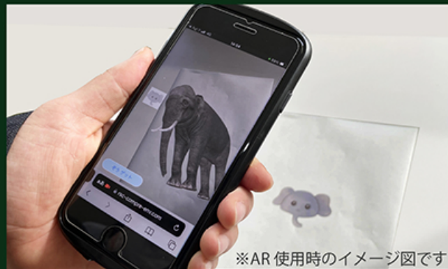
※AR使用時のイメージ図です

実在する風景にバーチャルの視覚情報などを重ねて表示することで、目の前にある世界を仮想的に拡張するというもので、現実世界とデジタルの世界を掛け合わせたような物になるのが特徴です。さまざまなゲームに使用されている技術です。